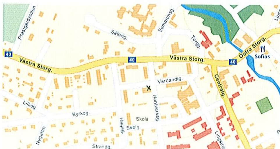
(karta till auktionslokalen)

Björn Waxegård Nifsarp Figgebo 1 575 96 EKSJÖ 076 - 86 48 661 bjorn@waxegard.se